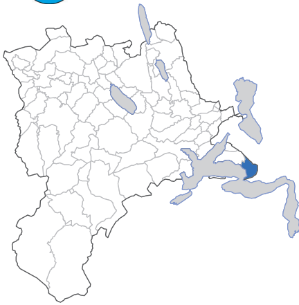
Vitznau an der Riviera des Kantons Luzern