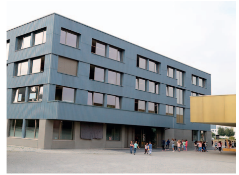
Schulhaus Reiden Mitte