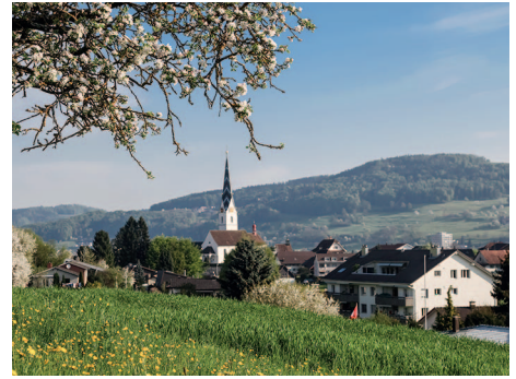
Frühling in Pfeffikon