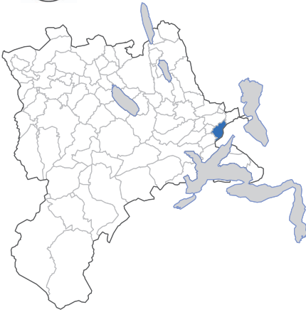
Udligenswil – Dorf mit Weitblick