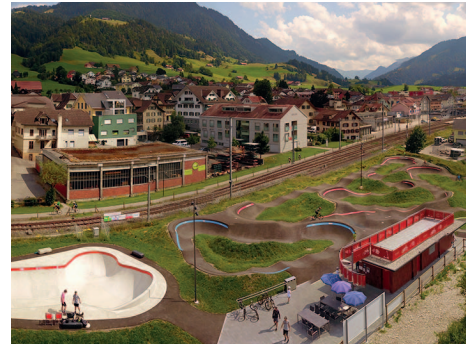
Rollsportpark in Schüpfheim