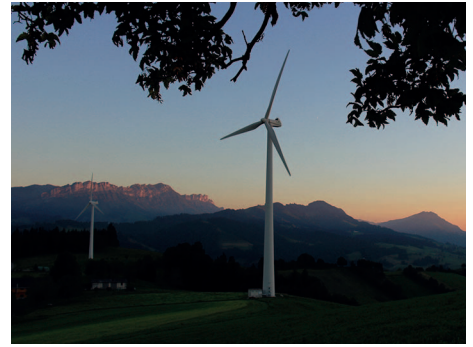
Windräder in Entlebuch bei Sonnenuntergang