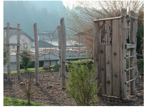
Spielplatz in Doppleschwand