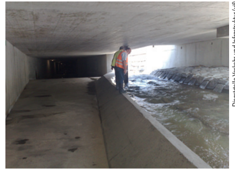
Dienststelle Verkehr und Infrastruktur (vfi)