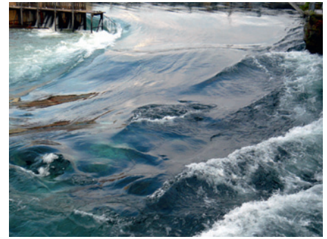
LUSTAT Statistik Luzern