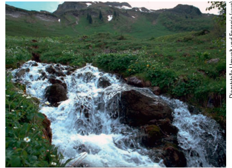
Dienststelle Umwelt und Energie (uwe)

Quellgebiet der Kleinen Emme am Briener Rothorn oberhalb von Sörenberg