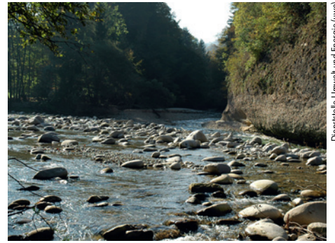
Dienststelle Umwelt und Energie (uwe)