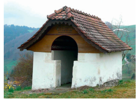
St. Antoniuskapelle, Landsberg

Bevölkerungsentwicklung Zwischen 1850 und 1900 Rückbildung des Bevölkerungsbestandes, danach Stagnation mit leichten Schwankungen bis 1980; seither Zuwachs auf derzeit 318 Einwohner/innen. Stand von 1850 mit 416 Personen wurde bisher nicht wieder erreicht