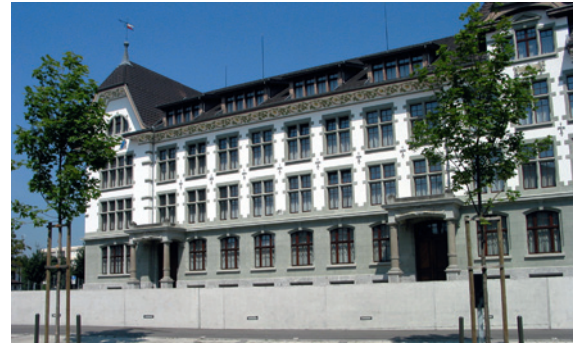
Schulhaus Alt St. Georg