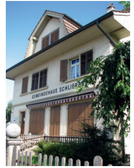
Das rund 100-jährige Haus diente früher als Ladenlokal, 1994 wurde es zur Gemeindekanzlei umgebaut