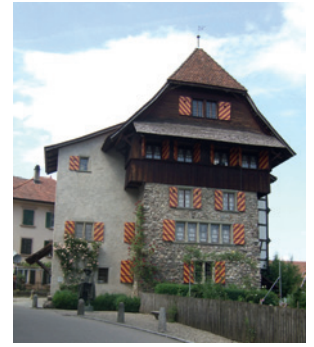
Im Schlossmuseum Beromünster ist die älteste Buchdruckerei der Schweiz zu sehen