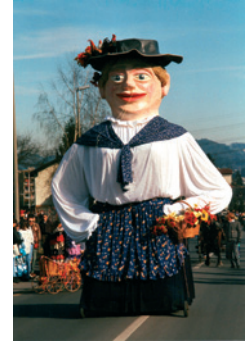
Eierrösi am Fasnachtsumzug Littau