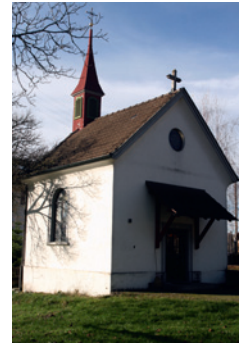
Die Andachtskapelle in Altwis wurde 1902 erbaut und 1980 renoviert