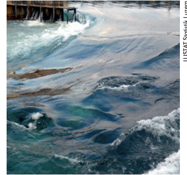
LUSTAT Statistik Luzern