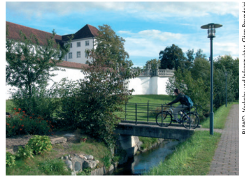
BUWD, Verkehr und Infrastruktur, Gian Paravicini