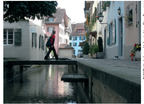
BUWID, Verkehr und Infrastruktur, Gian Paravicini