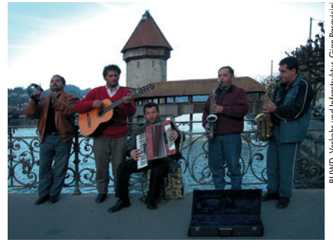
BUWD, Verkehr und Infrastruktur, Gian Paravicini