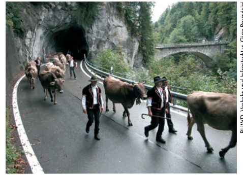
BUWID, Verkehr und Infrastruktur, Gian Paravicini